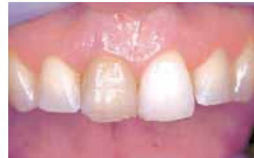
Dode tand vertoont donkere verkleuring.

vruchtensap, of andere kleurstof bevattende etenswaren. Bij het ouder worden kunnen er barstjes in het glazuur komen. Hierdoor dringen kleurstoffen uit voedsel en dranken nog makkelijker in de tand of kies. De ouderwetse almagaamvulling kan ook verkleuringen geven. Ook kunnen aanslag en verkleuring van tandsteen de tanden donkerder kleuren. Deze verkleuringen ontstaan eveneens door koffie, thee, wijn en roken. Verder kunnen gek genoeg sommige mondverzorgingsproducten met tin en chloorhexidine verkleuringen geven. Vraag dit aan uw mondzorgprofessional. Aanslag kan de tandarts of mondhygiënist door een professionele gebitsreiniging verwijderen. Bleken is hiervoor niet de oplossing. Dode tanden (meestal als gevolg van een val of klap) kunnen van binnenuit verkleuren. Dit kan ook gebeuren na een wortelkanaalbehandeling.