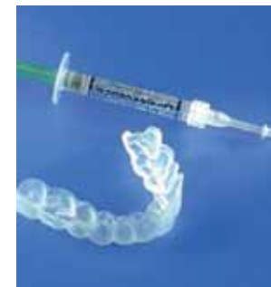
Van de tandarts of mondhygiënist krijg je de doorzichtige bleeklepel en de gel met de blekende werking mee naar huis

Eerst maakt de tandarts een opening aan de achterkant van de tand. Hierin brengt hij een papje of gel aan met het blekend middel. Deze producten hebben enkele dagen een blekende werking. Afhankelijk van het behaalde resultaat herhaalt de tandarts de behandeling één of meerdere keren. Uiteindelijk sluit hij de tand af met een definitieve vulling.