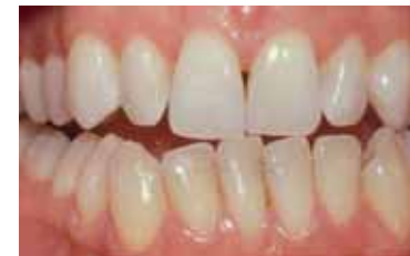
Resultaat na tien dagen bleken met de thuisbleekmethode onder supervisie van de tandarts